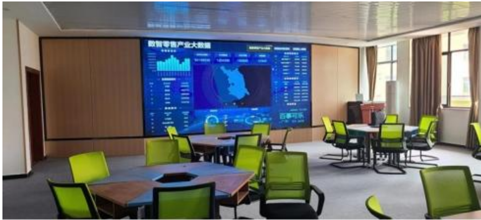
图 智慧零售运营中心