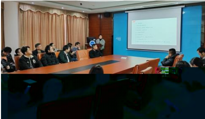
图 员工专业技能培训

，公 促 发 和 才 方 得 成 。 过 创 的 和 ， 不 动 公 的 持 成长， 工 供 的发 机会。 过 供多 化的 和发 ， “ 队 共 ” 等 活动 ( )， 帮 工 ( 技 和管 ； 并 的 和 规划， 工的 合 和 ， 包 导 发 计划、技 技 及 部 等， 地促 工的 方 发 。