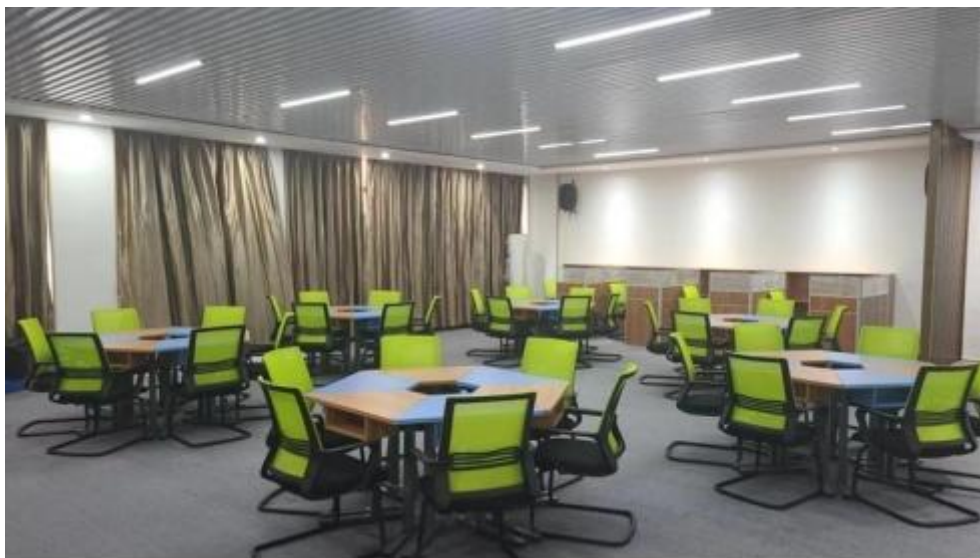
图 智慧零售运营中心