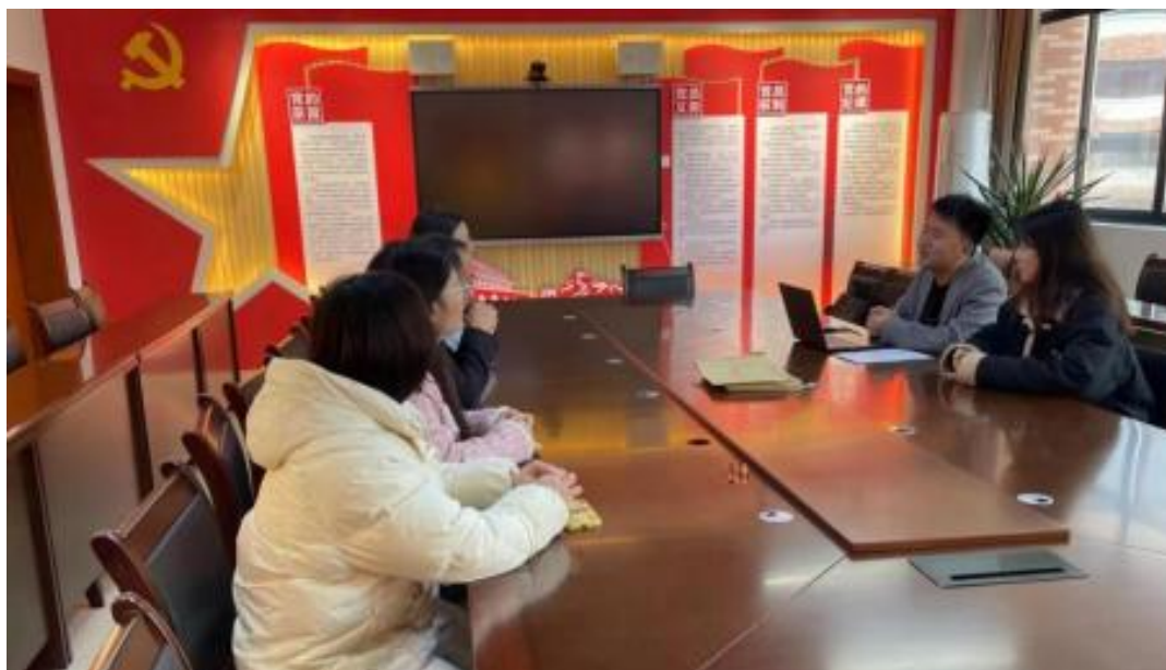
图 校企开展学术研讨项目交流会议

公 高度 队的 ，充分 到 和 的关 ，对 高 和 关 的 。此公 供 ，包 更 、 方法 及 导 发 程，并 持 丰富 的 家 过 、 会和 际案 ， 队 分 的 和 。 常 地 活动， 包 参加 会 、 等 ， 促 的 的 分 ， ， 并 的 队 ( )。